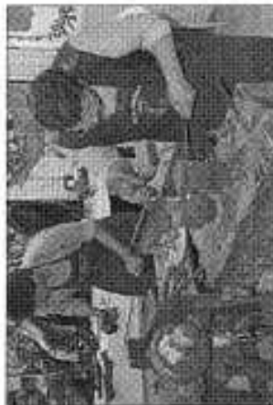
In piazza Domenica artigiani protagonisti a Cortona con ArTour Previste altre date