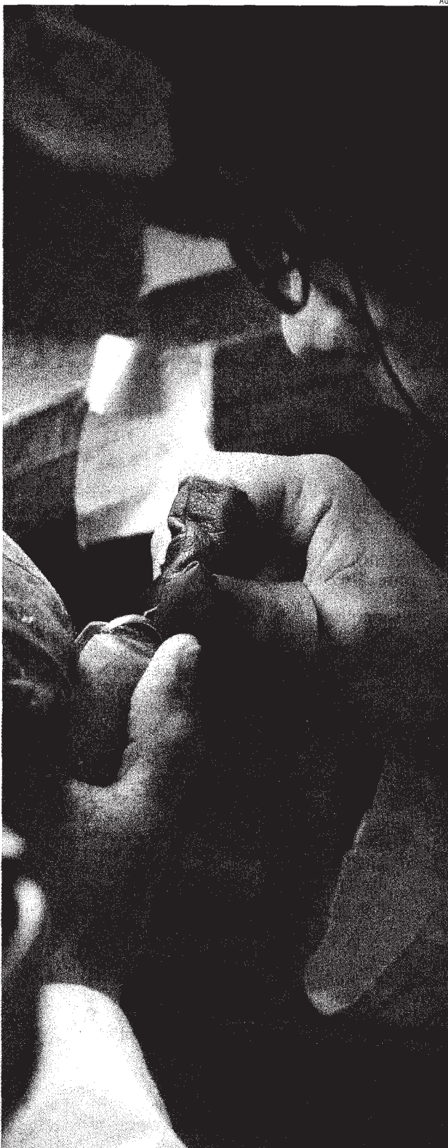
Prospettive. Nel 2011, sull'artigianato peserà l'accesso al credito