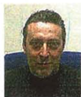
Meccanica Andrea Antonioli alla guida di Lastra, azienda familiare

Gli over 40 ritornano sui banchi di scuola. Questa non è soltanto la trama di un film in uscita («Immaturo»), è anche una strategia di business aziendale per non perdere competitività. Un'impresa che investe sull'aggiornamento professionale continuo dei dipendenti, senza considerare il numero di capelli bianchi, ha una marcia in più per affrontare le difficoltà della globalizzazione.