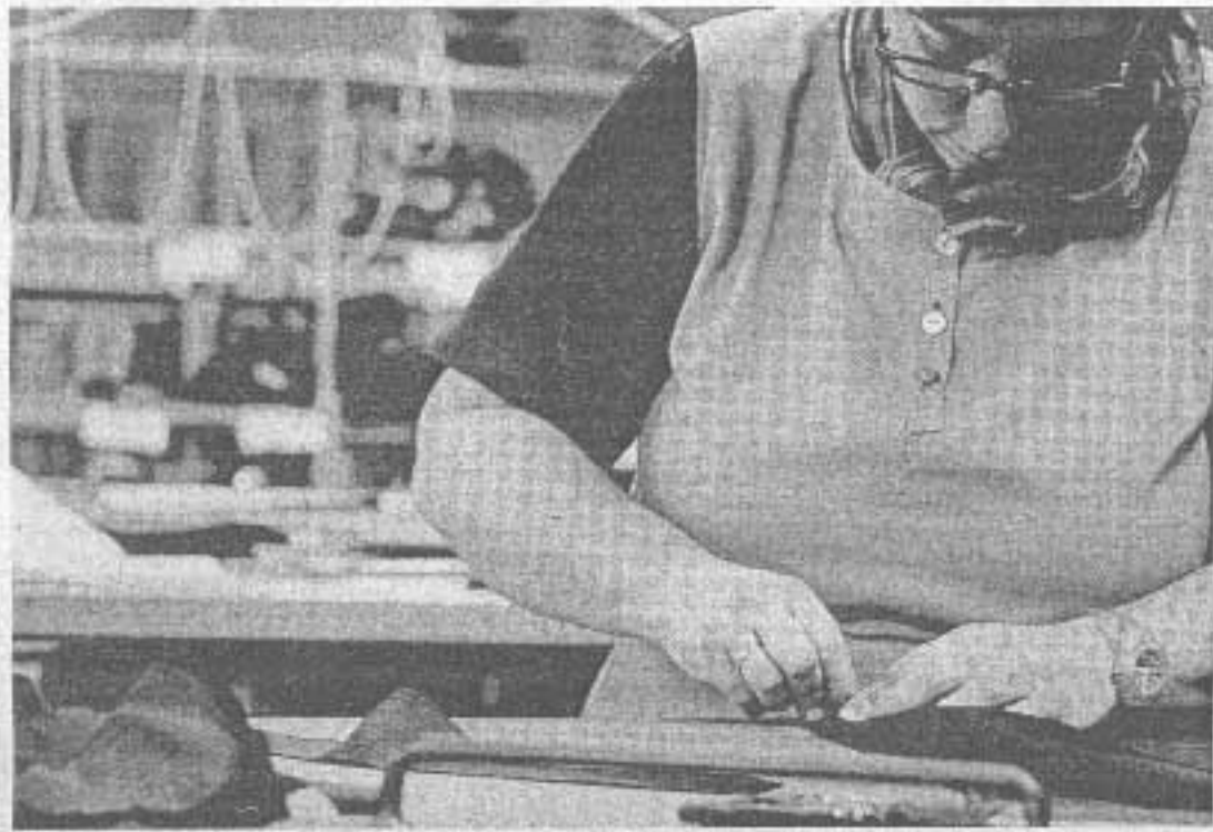
È all'esame del senato una proposta di legge che introduce, per il settore tessile, abbigliamento, calzaturiero, misure a sostegno delle produzioni italiane

La ripresa è debole. Molto più del previsto. Le micro, piccole e medie imprese, che più delle grandi hanno subito l'impatto della crisi, e che confidavano nel 2010 per rivedere un'accelerazione di ordinativi e fatturato, dovranno ancora attuare politiche di resistenza. Gli indicatori macroeconomici che arrivano dai bollettini previsionali dei vari istituti sono tutti concordi nel confermare una crescita del pil attorno all'1%, troppo poco per recu-