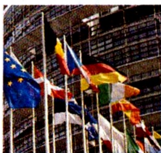
L'Unione Europea spinge l'export delle Pmi verso l'Est